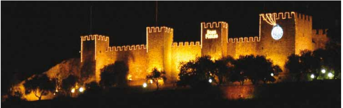
Montaje hecho con manguera de luz en el castillo San Jorge de Lisboa - Foto: Lisboa - Portugal Muntatge fet amb mànega lluminosa al castell de San Jorge de Lisboa - Foto: Lisboa - Portugal